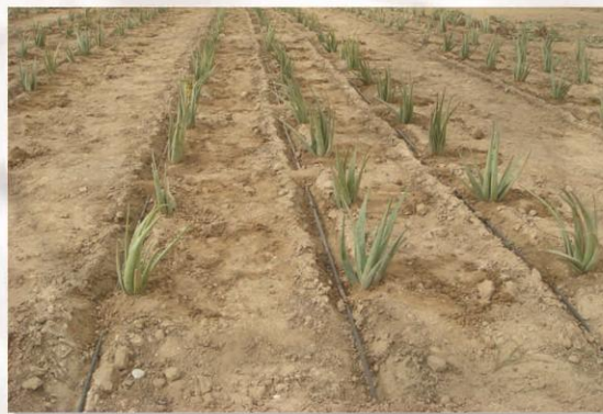
آبیاری قطره ای مزرعه صبر زرد