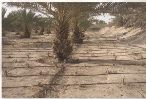
کشت توام نخل و آلوئه ورا