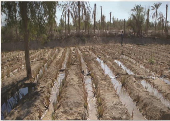
آبیاری جوی و پشته ای مزرعه صبر زرد

آبیاری گیاه دارویی صبر زرد به بافت خاک ، فصل زارعی ، کشت مختلط ، روش کاشت، روش آبیاری و وجود بادهای گرم در منطقه بستگی دارد در مناطقی که در حد وسیع کشت گیاه صورت می گیرد بایستی طوری آبیاری انجام شود که بازده اقتصادی داشته باشدو در ترکیبات موثر دارویی آن نیز خللی وارد نشود . آبیاری زمانی صورت می گیرد که گیاه حتماً یک دوره خشکی را گذرانده باشد. بافت سبک خاک ، بادهای گرم ، کشت های مختلط که سبب از دست دادن آب خاک مزرعه می شوند باعث کاهش ترکیبات پلی ساکاریدی می گردد . گیاه صبرزرد ریزوم دار است و بر روی آن ساقه های هوایی ایجاد می شود لذا خاک شنی - لومی برای کاشت این گیاه بسیار مناسب است .